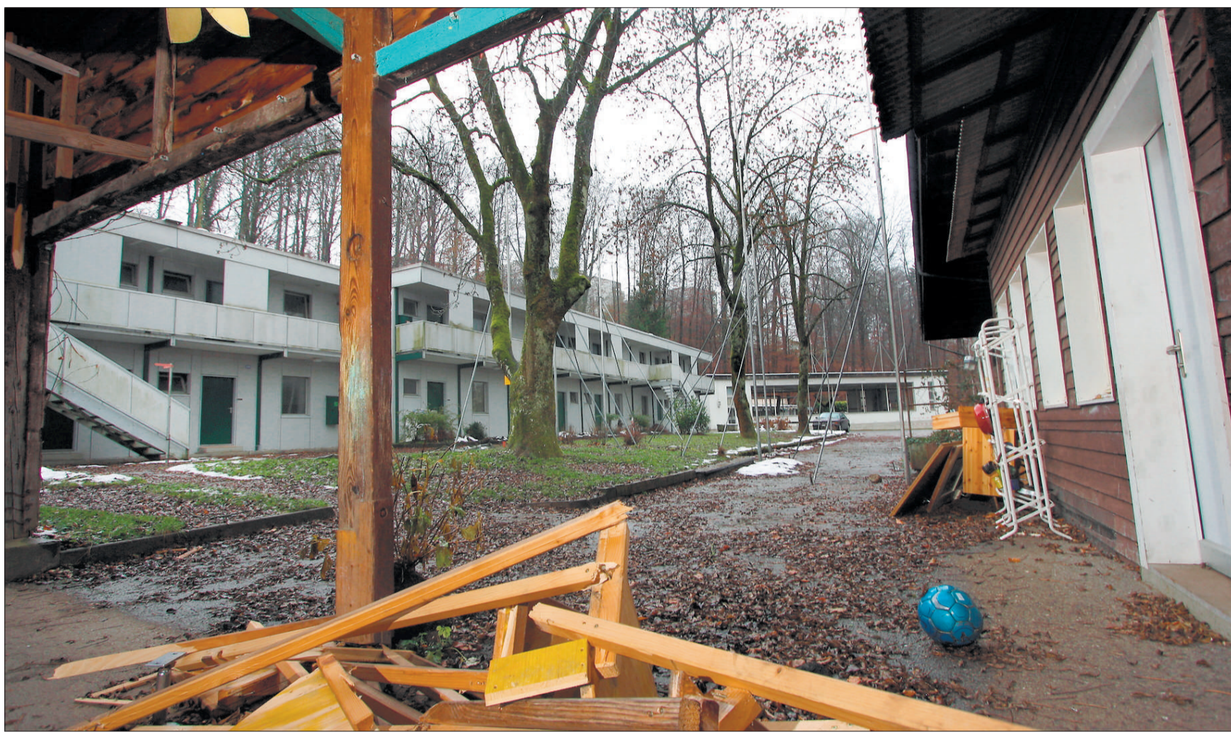
An der Zuger Metallstrasse ist das neue Hotel mit 82 Betten geplant.

Der rund 4500 Quadratmeter umfassende Neubau des Parkhotels wird wohl Abhilfe schaffen. Das Konzept ist voll auf Geschäftskunden ausgerichtet. Auf vier Geschossen befinden sich gleich-grosse Zimmer mit insgesamt 82 Betten. Im Erdgeschoss wird es eine Lobby und den Frühstücksraum mit insgesamt 65 Sitzplätzen geben. Ein Restaurant ist nicht vorgesehen – da wird sich die Kundschaft mit dem Angebot im Haupthaus zufrieden geben müssen. Hinter dem Neubau in Richtung Kantonsschule sind rund 50 Aussenparkplätze geplant. Die Technik wird in